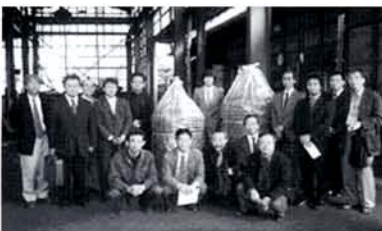
梵鐘と半鐘 (小田部鋳造)