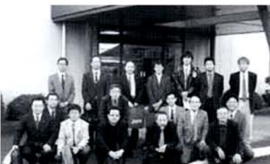
自動車鋳物(株) 玄関にて